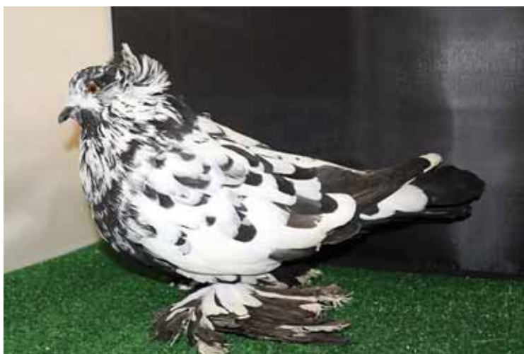
Kiss Imre junior fajtagyőztes tojó galambja