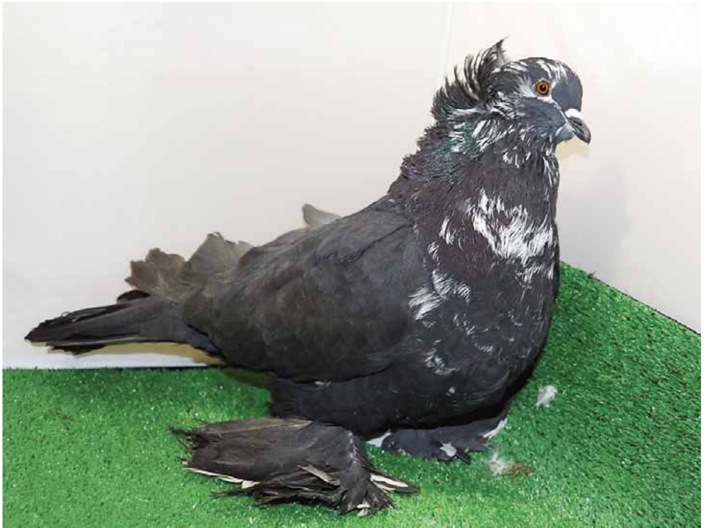
Kondoros 2019. Fajtaklub kiállítás Feketebabos hím (Józsa Tivadar)