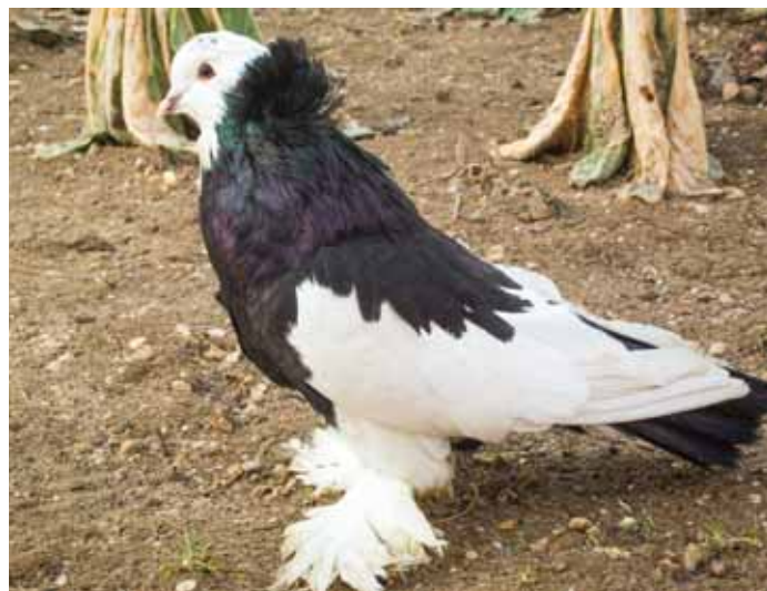
Réfi János szíves galambja

A klubhíradó költségei miatt a 2018. évi, a 2019. évi költségelszámolást, valamint a legfrissebb Fajtaklub Működési szabályzatot mellékletként, fénymásolat formában, feket-fehér színben mellékeljük. A múlt évi