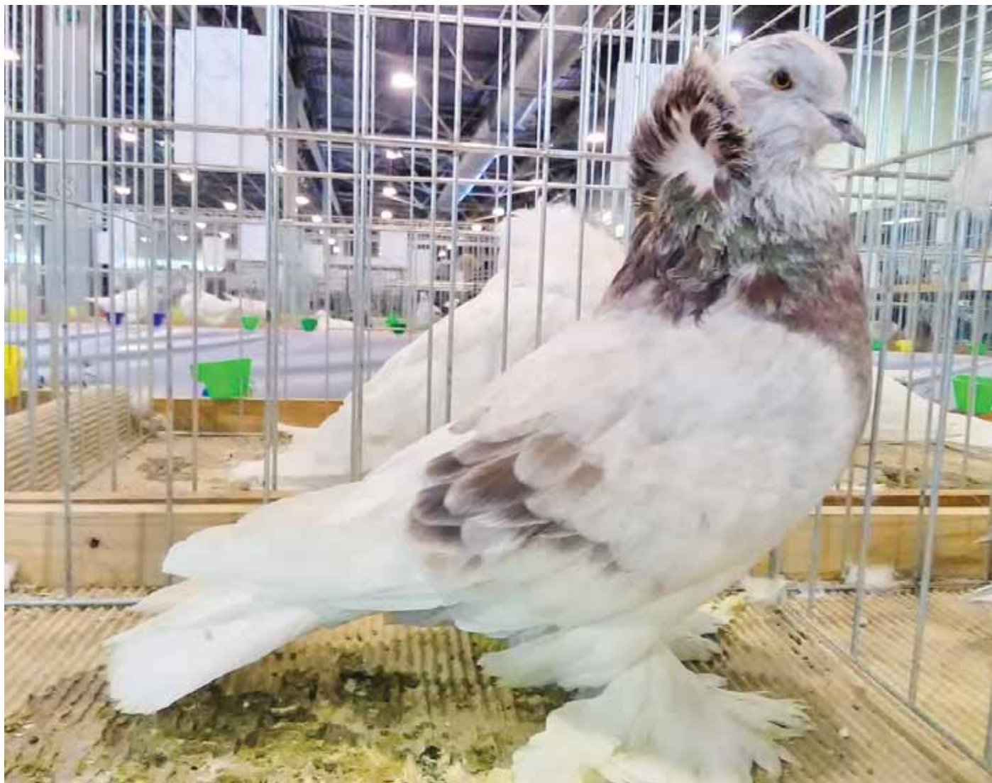
(2. kép) Heiland János - vörös deres hím, 95 pont