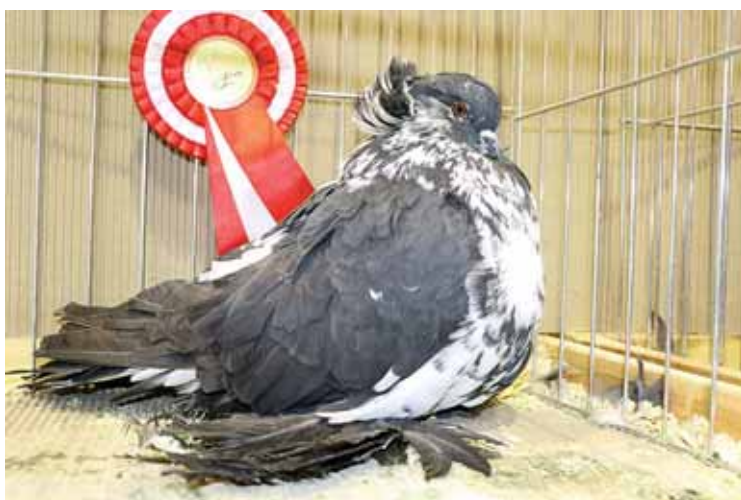
Szűj Dezső öreg fajtagyőztes tojó galambja